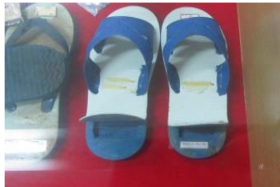
利用拖鞋夾帶違禁品