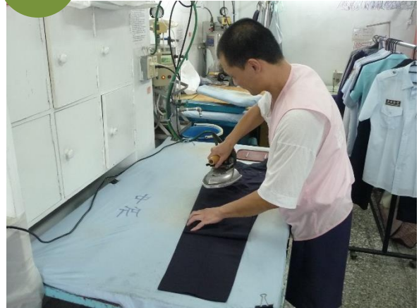
民國 107 年 洗衣部熨燙衣物