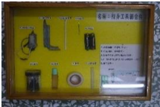
自製電動刺青工具

此次展覽活動該所動員全所職員的力量，展示出檔案文物的生命力與創造力，刻劃出歷史的痕跡，藉由此次的檔案文物展覽，讓社會大眾能見證該所歷史的軌跡與矯正處遇措施的演進，闡揚矯正機關教化心性、激濁揚清的功能。展覽現場並備有檔案應用文宣品，包括製作精美的杯墊及各式文具用品等，有興趣的民眾不妨抽空前往一探究竟，歡迎踴躍參觀。