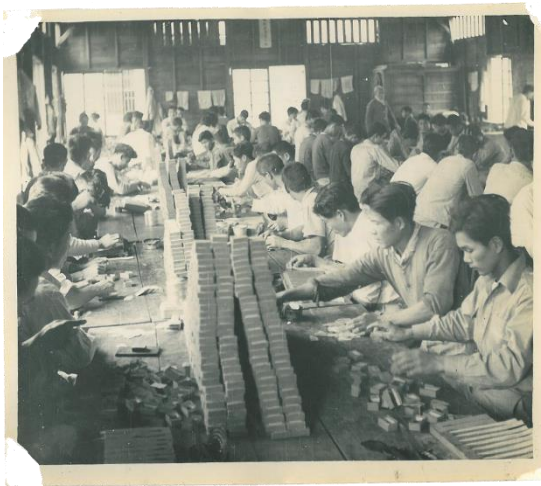
民國 46 年 黏盒科製作火柴盒情形