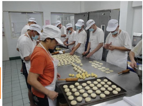
民國 107 年 食品工場作業情形