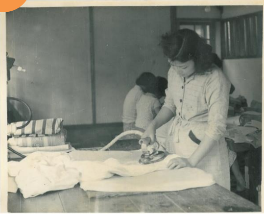
民國 45 年 洗衣科熨燙衣物