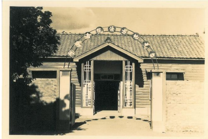
民國 42 年 臺中地方法院看守所 舊所大門