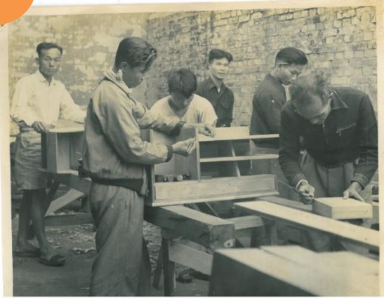
民國 45 年 木工科工作實錄