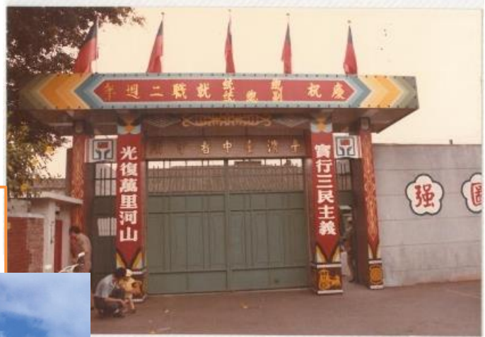
民國 107 年 法務部矯正署臺中看守所 新所大門