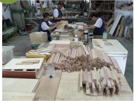
民國 107 年 木工場工作實錄