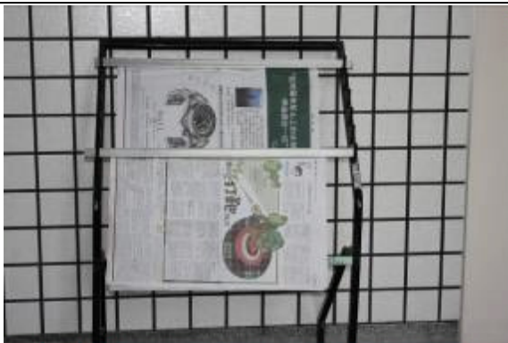
接見室備有書報、雜誌