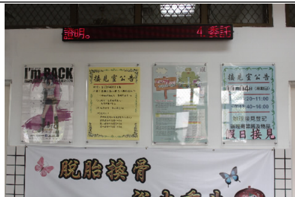
接見室公告相關接見作業程序