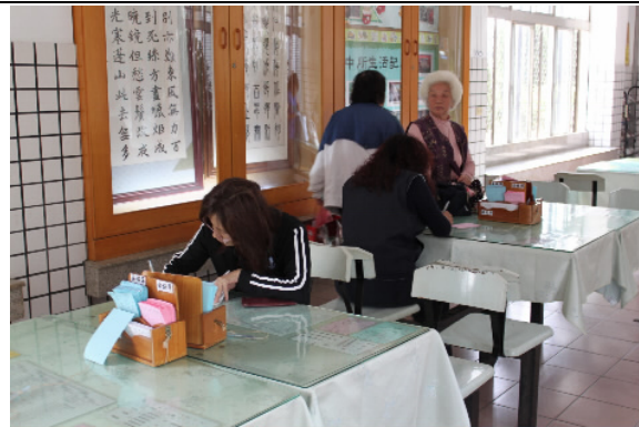
申辦櫃台置放申辦表單及範例供申請人參酌