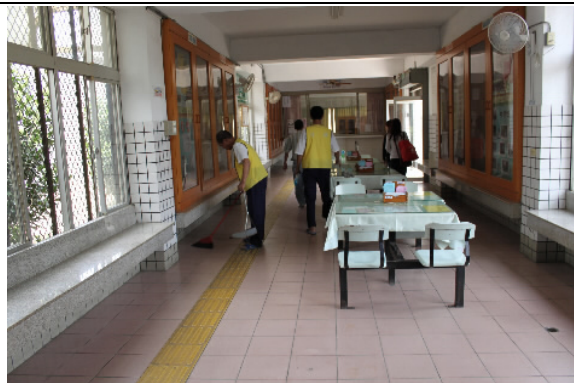
行政大樓及接見室每日派人清潔環境