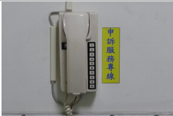
接見服務櫃台設有民眾申訴服務專線