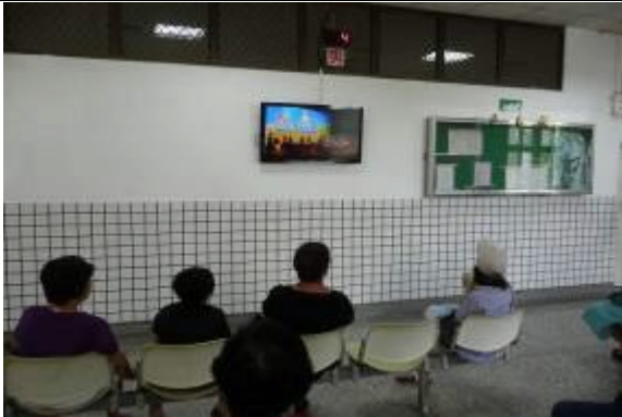
接見室內設有 42 吋液晶電視機