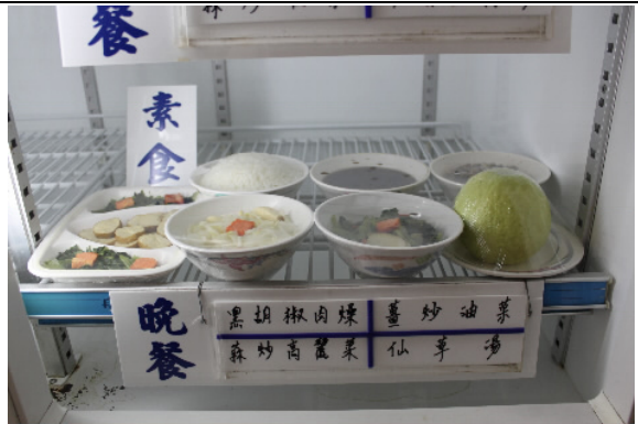
收容人伙食每日依季節性與營養需要調整菜色及變化口味