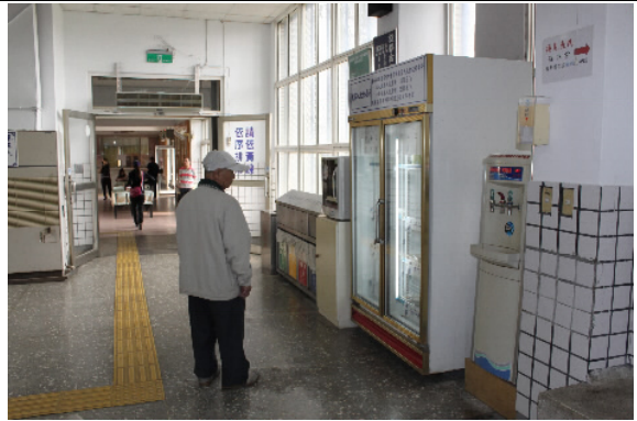
本所提供給收容人之三餐，展示家屬知悉