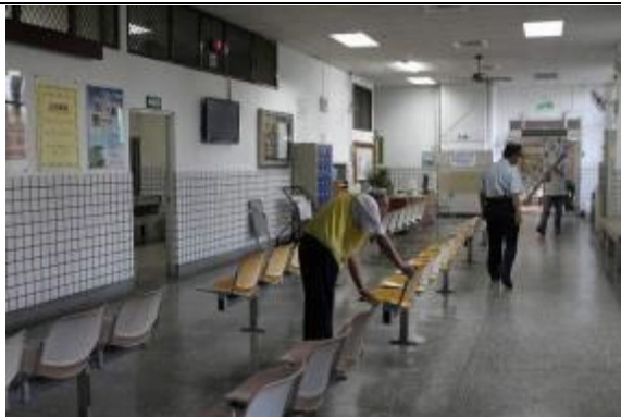
行政大樓及接見室每日派人清潔環境