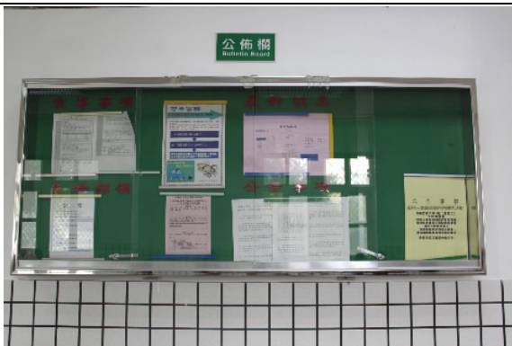
接見室公佈欄張貼接見相關法令規定