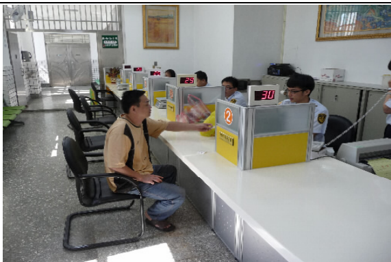
接見室服務櫃檯採開放式專人服務