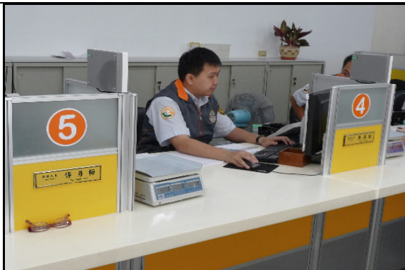
接見室服務櫃檯採開放式專人服務