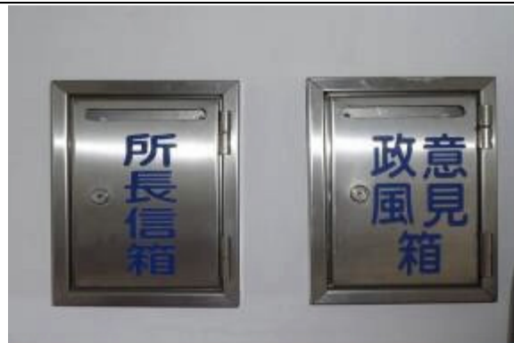
接見室設有陳情信箱