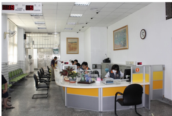
改裝後之接見室服務櫃檯