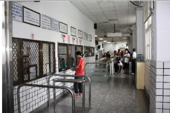
改裝前之接見室服務櫃檯