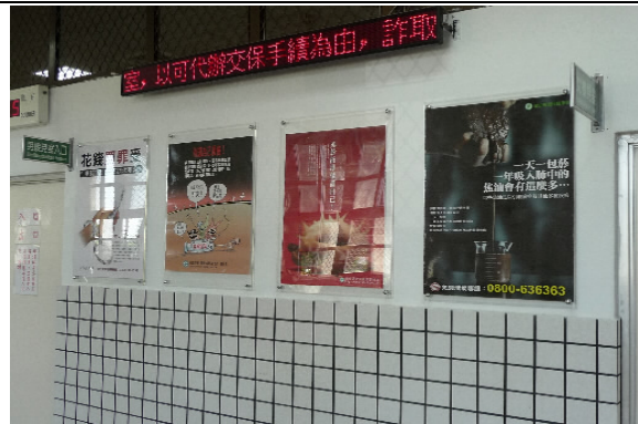
接見室公告欄及跑馬燈等方式進行資訊公開