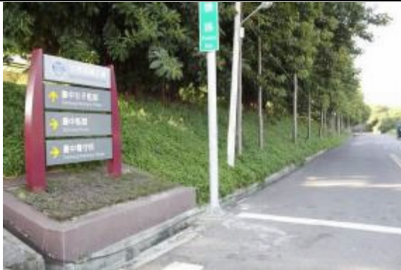
本所於聯外主要道路設置指示牌