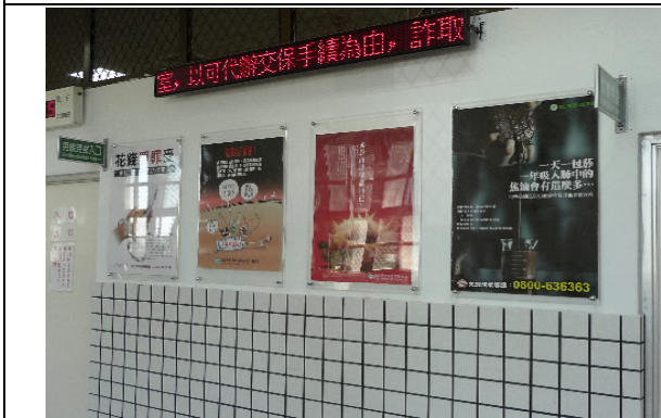
另設電腦字幕機 可不定時提供民眾相關接見規定