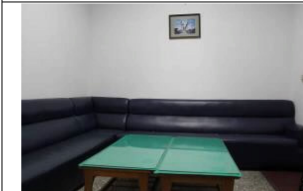
行政大樓接待室及各科室辦公室設沙發座椅