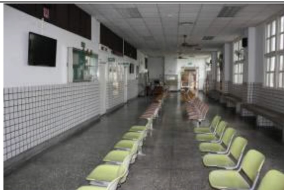
接見室設置一般靠背之座椅