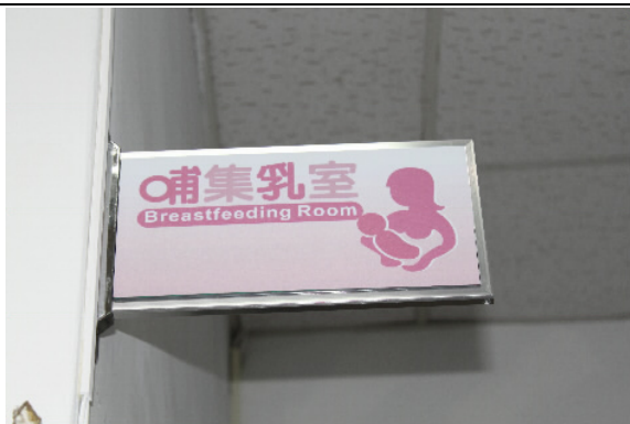
接見室設有哺乳室提供洽公女性民眾需求