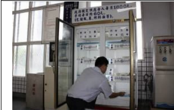
接見室設置伙食展示櫃