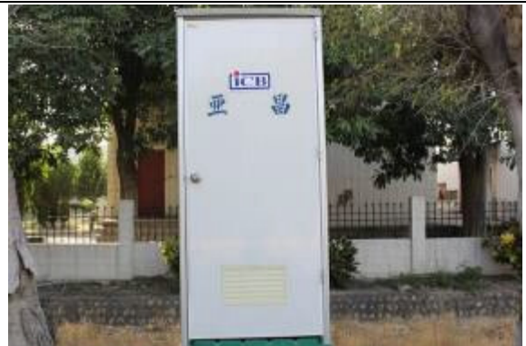
家屬接見停車場上設有流動廁所