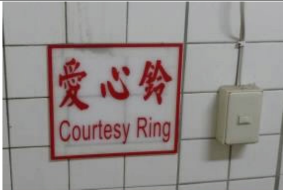
接見室設有愛心鈴