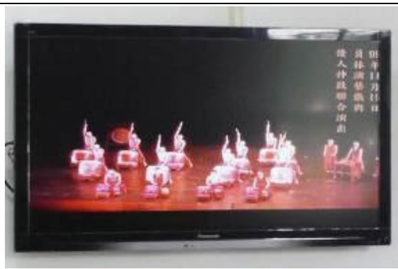
定時播放收容人生活藝文活動及衛教等宣導