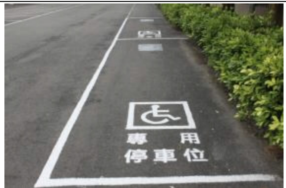
提供洽公及接見家屬身心障礙停車位