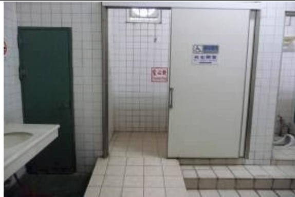
提供接見民眾殘障廁所