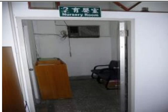
行政大樓設有育嬰室提供洽公女性民眾需求