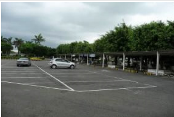
提供洽公及接見家屬寬敞之免費停車場