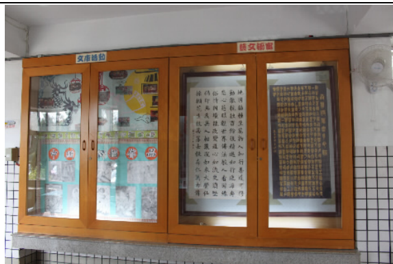
說展示櫥窗展示各項業務之施政績效