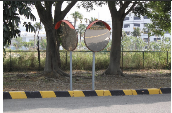
本所於聯外主要道路設置大型安全反視鏡