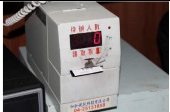
接見室設置號碼機