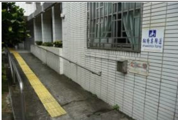
提供接見民眾輪椅專用道