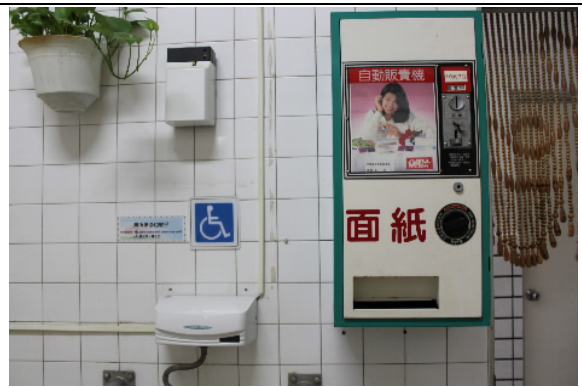
家屬候見室設置自動販賣機