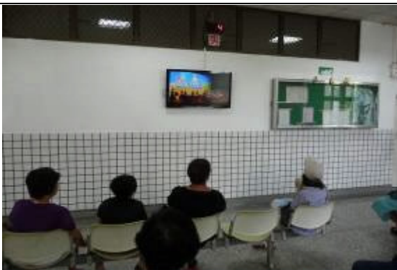
接見室內設有 42 吋液晶電視機