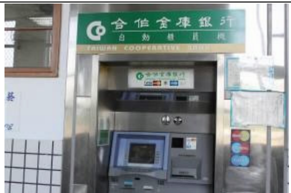
本所裝設自動提款機 方便洽公民眾與同仁使用