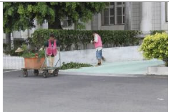
落實辦公廳舍周邊 50 公尺內環境清潔之執行