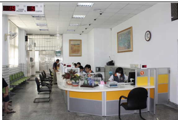
改善後之接見室之服務櫃檯