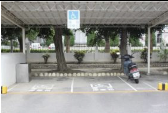
提供洽公及接見家屬機車停車位