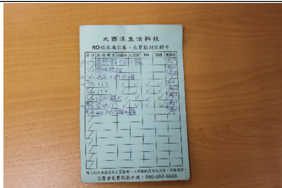
定期保養更換濾心並作成紀錄 確保飲用衛生之安全