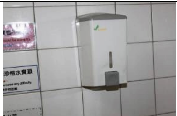
盥洗室供應衛生紙、洗手乳及擦手紙等物品