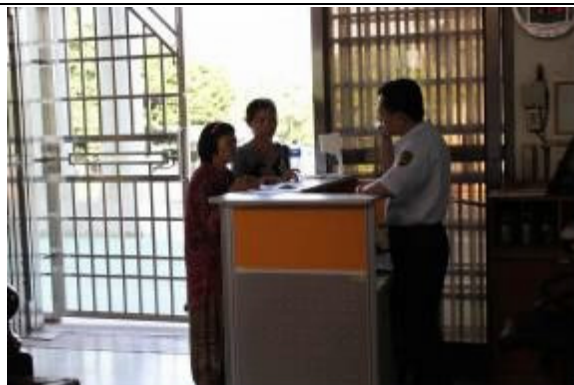
大門入口處設置不打烊綜合服務台 由值勤人員引導並提供各項業務諮詢服務