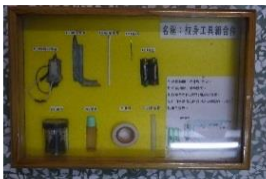
自製電動刺青工具

此次展覽活動該所動員全所職員的力量，展示出檔案文物的生命力與創造力，刻劃出歷史的痕跡，藉由此次的檔案文物展覽，讓社會大眾能見證該所歷史的軌跡與矯正處遇措施的演進，闡揚矯正機關教化心性、激濁揚清的功能。展覽現場並備有檔案應用文宣，內裝收容人自營作業產品「南瓜子脆片」供參觀民眾取用，清脆爽口，有興趣的民眾不妨抽空前往一探究竟，歡迎踴躍參觀。