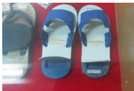
利用拖鞋夾帶違禁品