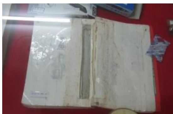
利用書本夾帶違禁品