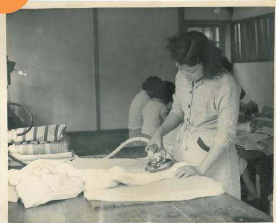
民國 45 年 洗衣科熨燙衣物