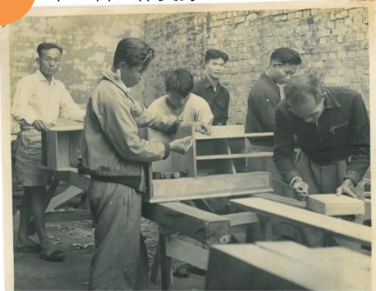
民國 45 年 木工科工作實錄