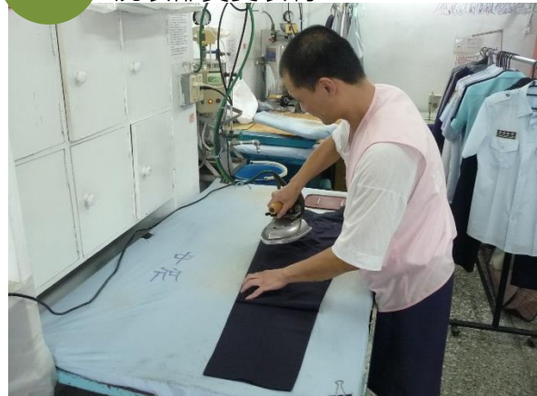
民國 107 年 洗衣部熨燙衣物