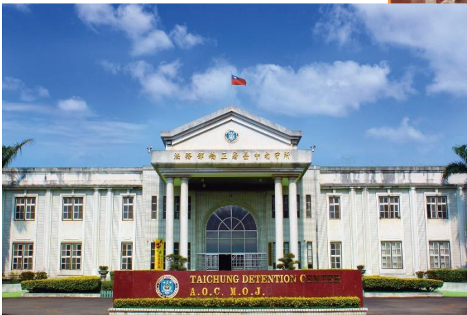
民國 107 年 法務部矯正署臺中看守所 新所大門